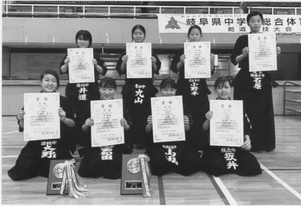
女子個人の部 上位入賞8選手