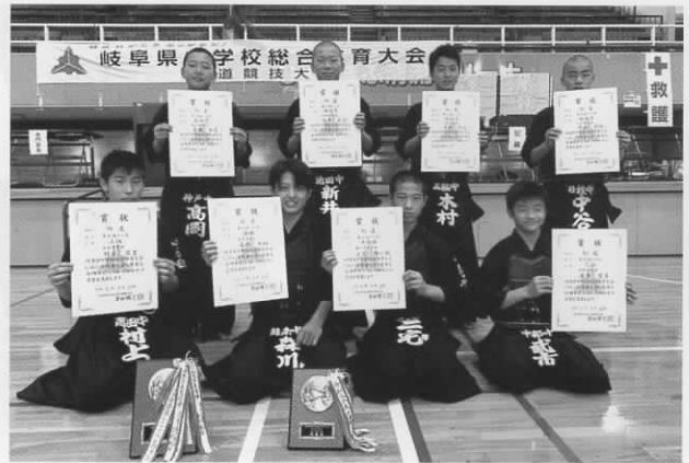
男子個人の部 上位入賞8選手